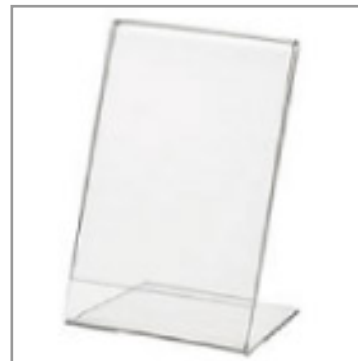
POP用アクリル スタンド (大) A4