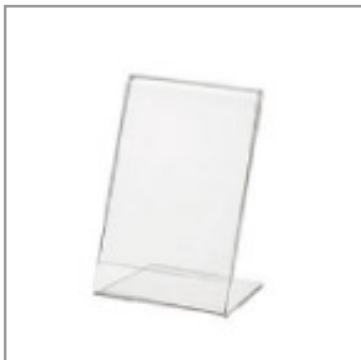
POP用アクリル スタンド(小)L版