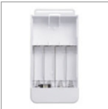
電池パック ラピナビLight用